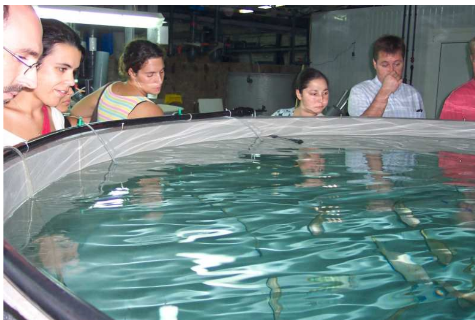
(Obtenida en Internet)

Parece claro que el desarrollo de la acuicultura aportará en el futuro una alternativa importante al dilema entre el crecimiento de la demanda de productos pesqueros y el agotamiento de los recursos, que habitualmente se extraían de los caladeros interiores y exteriores.