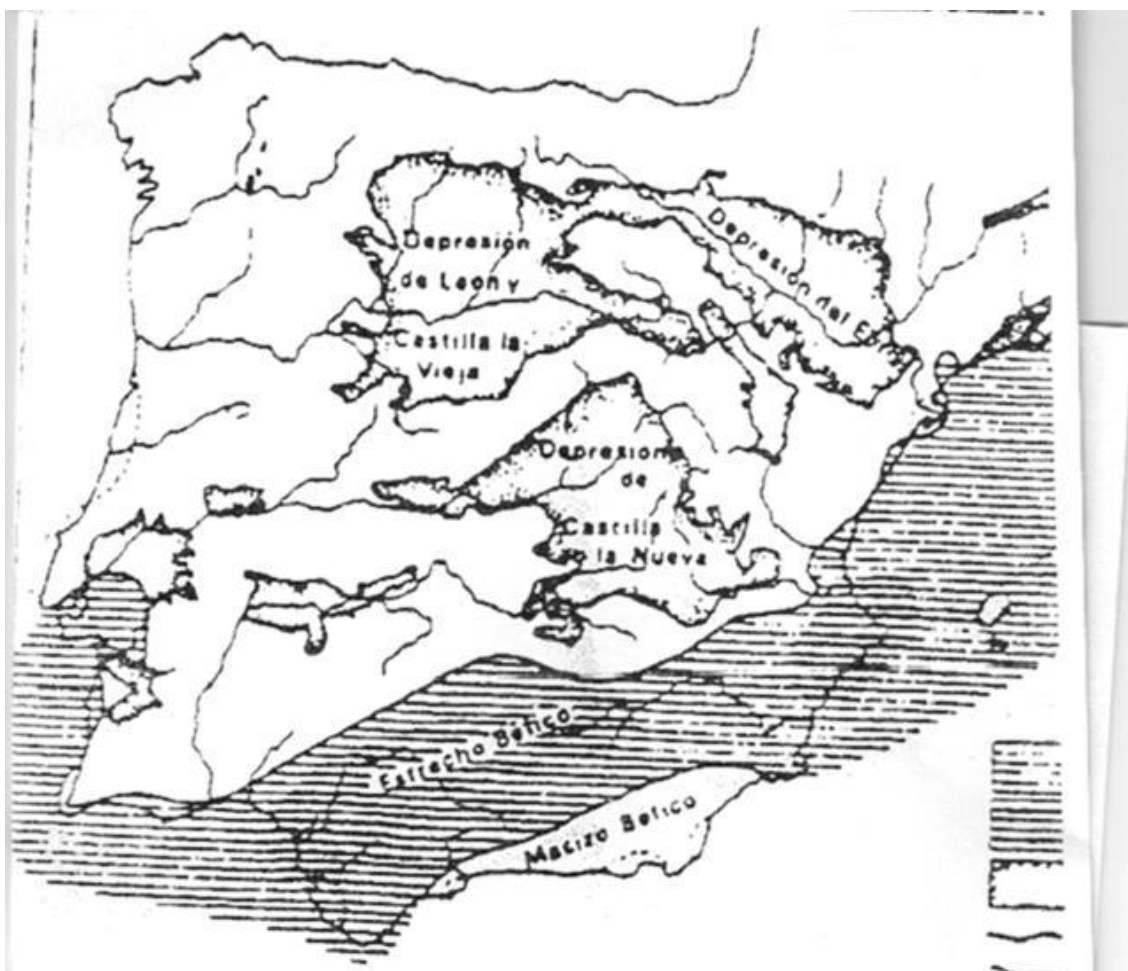
La Península Ibérica durante la Era Terciaria.